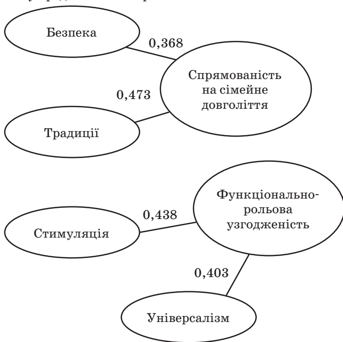
Рис. 2. Взаємозв'язок ціннісних орієнтацій із компонентами психологічного здоров'я сім'ї

Встановлено взаємозв'язок ціннісних орієнтацій із компонентами психологічного здоров'я сім'ї. Результати кореляційного аналізу представлено на рис. 2.