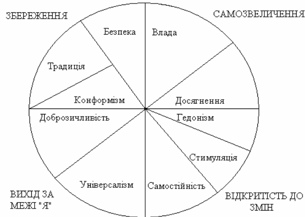
Рис. 1. Модель взаємозв'язків десяти типів цінностей за Ш. Шварцом

Ш.Шварц вважає, що найбільш істотним аспектом, який лежить в основі відмінностей між різними групами цінностей, є тип мотиваційної цілі. На підставі аналізу цінностей різних культур, а також релігійних і філософських праць автор виокремив універсальні цінності, згрупував їх та визначив десять типів цінностей, згідно з відповідними мотиваційними цілями [11]: