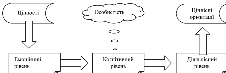
Мал. 2. Схема особистісного аксіогенезу (за В.Ю.Дмитрієвим)

Цінність досягається людиною одразу на емоційному рівні (викликає позитивні емоції при міжособистісній взаємодії), тоді сприймається на когнітивному (осмислення важливості у соціальних трансакціях), підтверджується при особистому застосуванні (діяльнісний рівень), і тільки після цього засвоюється особистістю, стає її ціннісною орієнтацією (див. мал.2).