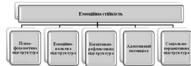
Рис. 2. Структура емоційної стійкості

психологічних передумов емоційної стійкості.